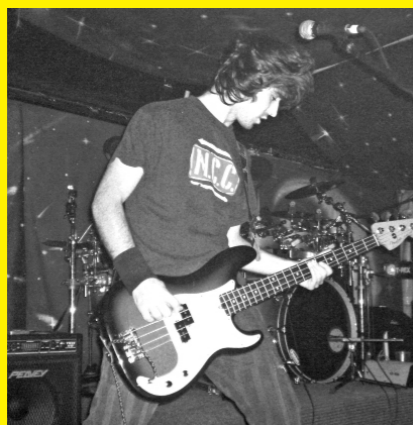
Piki, bajo y coros